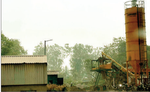
कोरबा पश्चिम संयंत्र परिसर में स्थापित बैचिंग प्लांट।