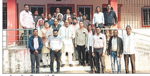
कार्यक्रम में उपस्थित कांग्रेसी।