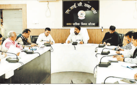
अधिकारियों को निर्देश देते निगम आयुक्त।