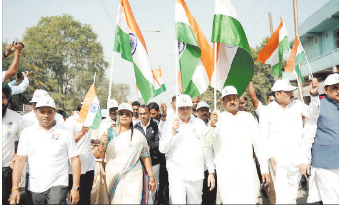
यूनिटी मार्च में शामिल राज्यसभा सांसद, उद्योग मंत्री, महापौर, विधायक श्री पटेल, कलेक्टर सहित विभिन्न स्कूल के बच्चे व नागरिकगण।