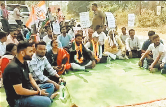
प्रदर्शन करते कांग्रेसी।

निगम क्षेत्र में दादर रोड की बहाल स्थिति को लेकर कांग्रेस ने धरना प्रदर्शन किया। कांग्रेस नेताओं ने आरोप लगाया कि शहर और ब्लॉकों की सड़कें जर्जर हो चुकी हैं, लेकिन राज्य सरकार और निगम प्रशासन इस पर ध्यान नहीं दे रहा है। उनका आरोप है कि निगम के 900 करोड़ और डीएमएफ के 600 करोड़ के बावजूद सड़कों की हालत बर्दाहल है। कांग्रेस नेताओं ने चेतावनी दी कि अगर जल्द सड़कों की मरम्मत और बुनियादी सुविधाओं का सुधार नहीं किया गया, तो आंदोलन और तेज