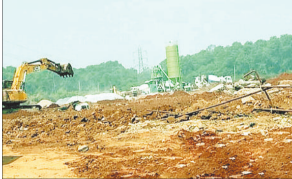
विस्तार संयंत्र परिसर में स्थापित बैचिंग प्लांट।

छत्तीसगढ़ राज्य विद्युत उत्पादन कंपनी के कोरबा पश्चिम संयंत्र परिसर में बिना अनुमति बैचिंग प्लांट शुरू करने का मामला सामने आया है। संयंत्र में बैचिंग प्लांट लगाने के लिए ना ही जिला स्थल अनुमोदन समिति से अनुमति ली गई है और ना ही नगर निगम के भवन निर्माण शाखा में किसी भी प्रकार के संयंत्र निर्माण की अनुमति के लिए आवेदन दिया गया है। बिना अनुमति के ही बैचिंग प्लांट का संचालन किया जा रहा है, जो विद्युत कंपनी की कार्य प्रणाली पर संचालित निशान खड़ा कर रहा है।